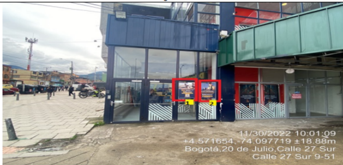
Fotografía No. 4

En la cual se evidencian dos (2) elementos PEV, con orientación visual sobre la calle 27 Sur pertenecientes al establecimiento comercial FITNESS24SEVEN 20 JULIO , propiedad de la sociedad FITNESS24SEVEN COLOMBIA S A S , los cuales se encuentran incorporados en las puertas de la edificación y son adicionales al único elemento permitido por fachada de establecimiento comercial.