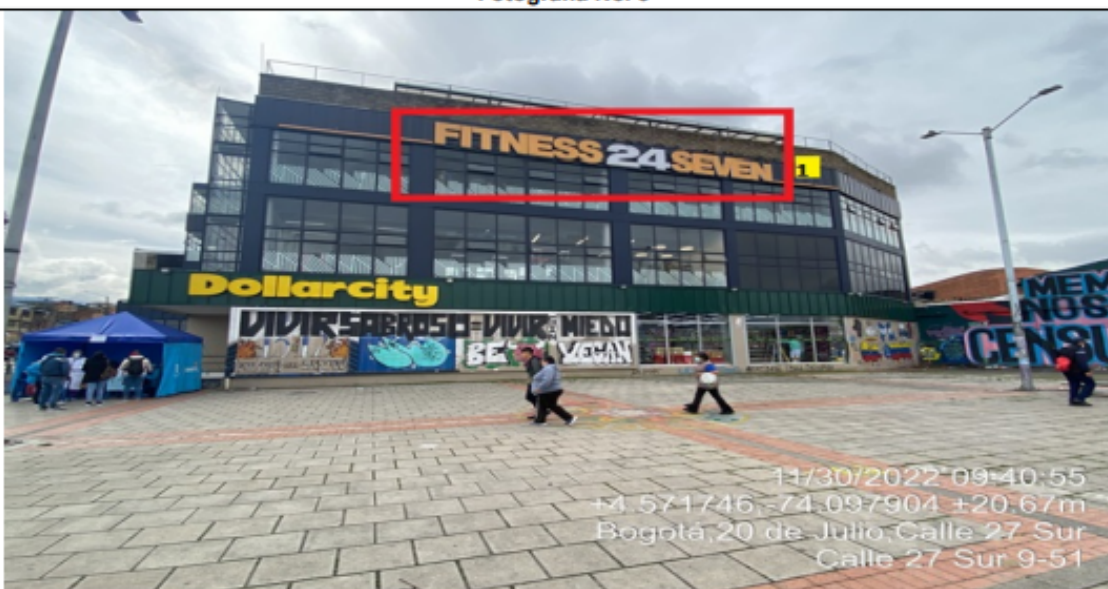
Fotografía No. 3

En la cual se evidencia un (1) elemento tipo aviso en fachada, ubicado con orientación visual sobre la carrera 10 perteneciente al establecimiento FITNESS24SEVEN 20 JULIO , propiedad de la sociedad FITNESS24SEVEN COLOMBIA S A S , el cual se encuentra ubicado en antepecho superior al segundo piso de la edificación.