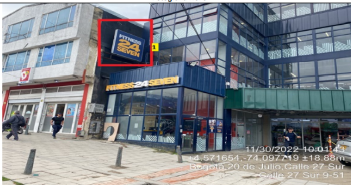
Fotografía No. 5

En la cual se evidencia un (1) elemento tipo aviso en fachada, ubicado con orientación visual sobre la calle 27 sur perteneciente al establecimiento FITNESS24SEVEN 20 JULIO , propiedad de la sociedad FITNESS24SEVEN COLOMBIA S A S , el cual es adicional al único elemento permitido por fachada de establecimiento comercial.